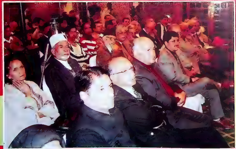
آئینہ نما (7) کے شمارے کی رسم اجراء (چند جھلکیاں)