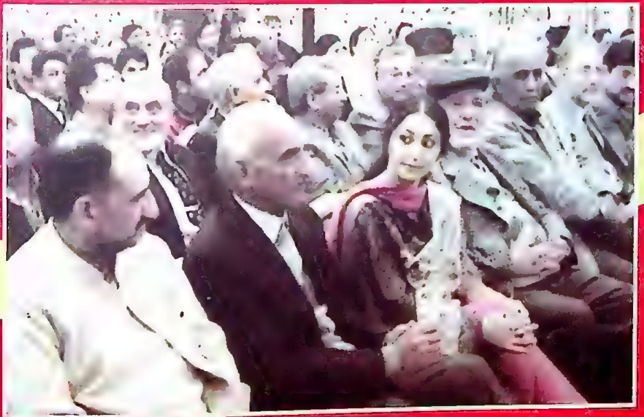
آئینہ نما (7) کے شمارے کی رسم اجراء (چند جھلکیاں)