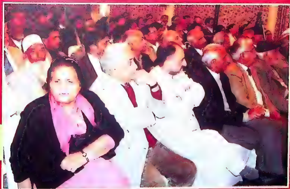
آئیڈیو نمبر (7) کے شمارے کی رسم اجراء (چند جھلکیاں)