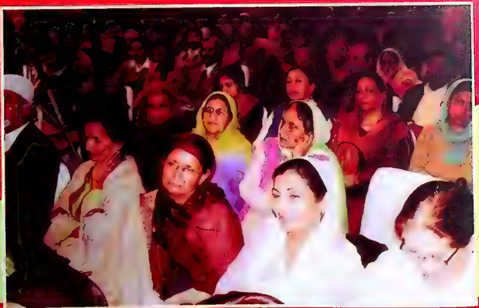
آئینہ نما (7) کے شمارے کی رسم اجراء (چند جھلکیاں)